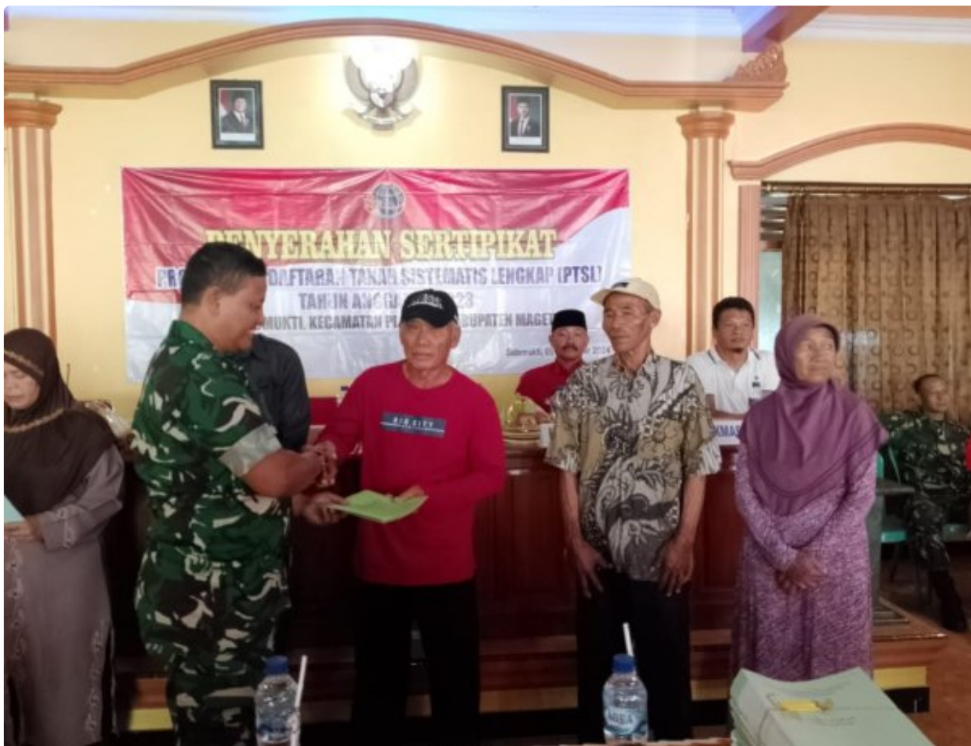
Danramil 0804/02 Plaosan Hadiri Penyerahan Sertifikat Program Pendaftaran Tanah Sistematis Lengkap (PTSL) Desa Sidomukti

PLAOSAN. - Desa Sidomukti melalui Badan Pertanahan Nasional (BPN)